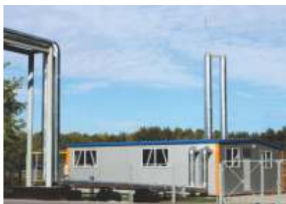
Блочно-модульная газовая котельная, мощностью 5,1 МВт.