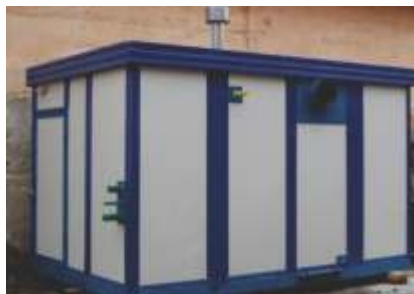
Блочно-модульная котельная, мощностью 0,3 МВт.