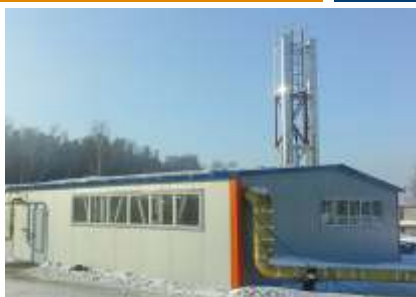
Блочно-модульная котельная №3, мощностью 4,5 МВт.