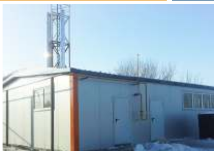
Блочно-модульная котельная №4, мощностью 3,06 МВт.

с. Вагайцево, Ордынского района, Новосибирская область