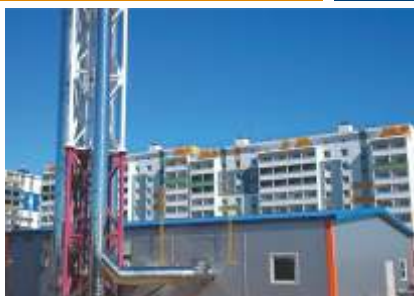
Блочно-модульная газовая котельная, мощность 30 МВт.

г. Хабаровск, РАО ЕС Востока (ОАО «ДГК»)