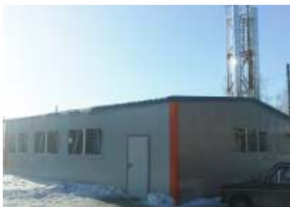
Блочно-модульная котельная №6, мощностью 6,4 МВт.

с. Вагайцево, Ордынского района, Новосибирская область