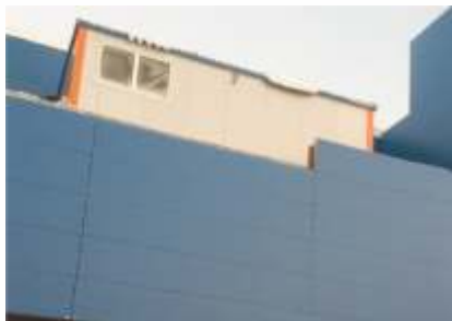
Крышная блочно-модульная котельная, мощностью 2 МВт.