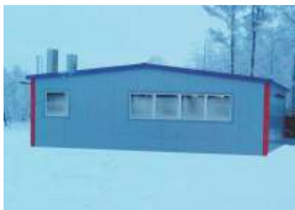
Блочно-модульная газовая котельная, мощность 4 МВт.

п. Намцы, Намский район, Республика Саха (Якутия)