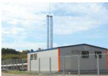
Блочно-модульная газовая котельная, мощностью 3,7 МВт.