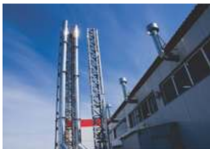
Стационарная котельная в капитальном здании, мощностью 6 МВт.