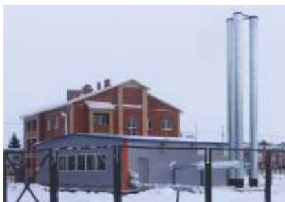
Блочно-модульная котельная, мощностью 4,2 МВт и инженерные сети

р.п. Коченево, Коченевский район, Новосибирская область