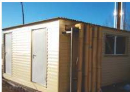
Блочно-модульная газовая котельная, мощность 0,5 МВт.