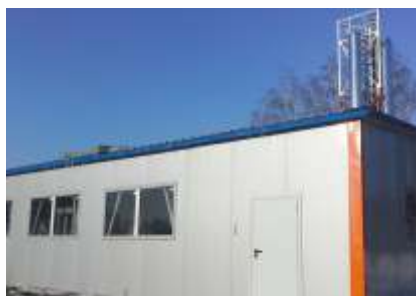
Блочно-модульная котельная №2, мощностью 9 МВт.