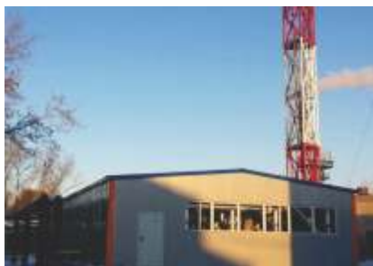
Блочно-модульная котельная мощностью 9 МВт.