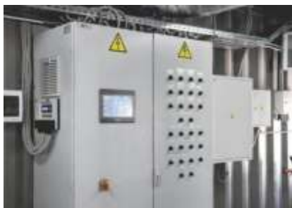
Блочно-модульная газовая котельная, мощностью 0,1 МВт.