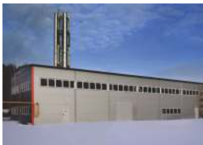
Газовая котельная мощность 25 МВт

п. Геофизиков г. Обь, Новосибирская область