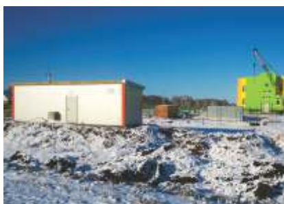
Блочно-модульная газовая котельная, мощность 1,194 МВт.

г. Болотное, Болотнинского района Новосибирская область