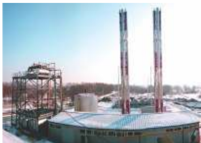
Блочно-модульная котельная мощностью 35,1 МВт