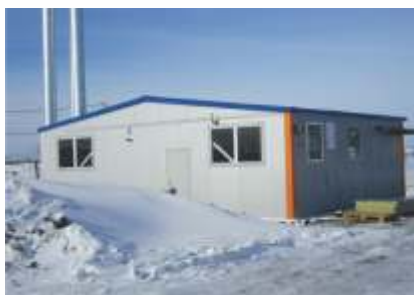
Блочно-модульная газовая котельная, мощностью 4,3 МВт.